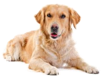
สุนัข Dog 狗(Gǒu)

* นักเรียนฝึกฝนคำศัพท์เป็นภาษาไทย, ภาษาอังกฤษ และ ภาษาจีนในทุกๆ เข้าครับ