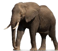
ช้าง Elephant 大象(Dà xiàng)