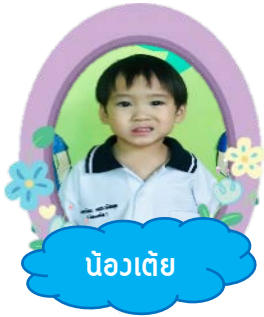
น้องเต้ย